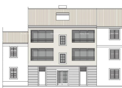
JUGOZAPADNO PROČELJE MJ=1:100